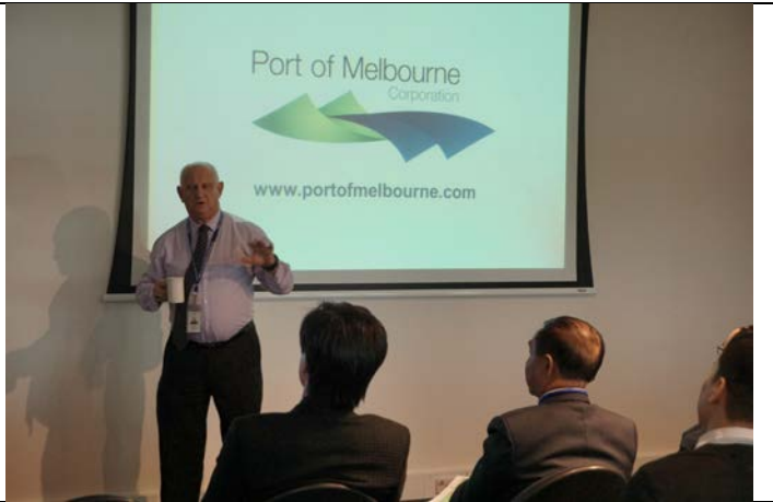
Làm việc tại cảng Melbourne, học tập các quy định về thông quan hàng hoá khi tiến hành thủ tục XNK tại cảng