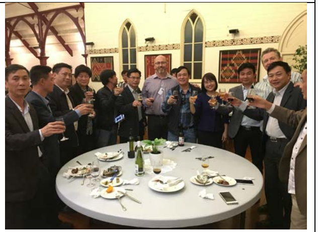
Tiệc giao lưu văn hoá và thưởng thức sản vật địa phương tại Auckland, New Zealand