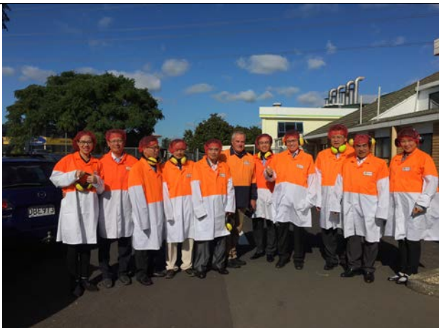
Tham quan cơ sở một doanh nghiệp sản xuất thức ăn nhanh tại thành phố Auckland