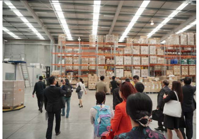
Làm việc với công ty sản xuất thực phẩm chức năng tại NZL, học hỏi chuỗi cung ứng, phân phối sản phẩm