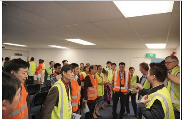
Làm việc với một doanh nghiệp sản xuất & XNK hoa quả, các sản phẩm nông nghiệp tại Auckland, New Zealand