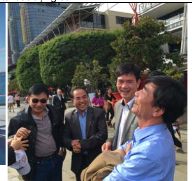
Tham quan và tìm hiểu văn hoá, cảnh vật, con người tại Sydney, Úc