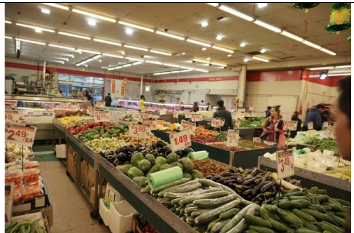
Tham quan các chuỗi siêu thị hàng hoá, tìm hiểu cách thức đưa hàng Việt Nam vào các chuỗi siêu thị Úc