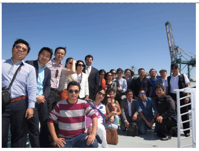
Du thuyền Khảo sát thực tế quy trình vận chuyển, thông quan hàng hoá tại cảng quốc tế Los Angeles