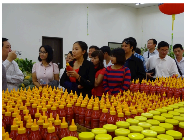
Gặp gỡ doanh nhân Việt thành công tại thị trường Mỹ