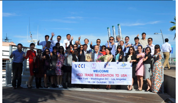
Làm việc với Ban Giám đốc cảng tàu container quốc tế Los Angeles – khảo sát về thủ tục hải quan và quy trình XNK