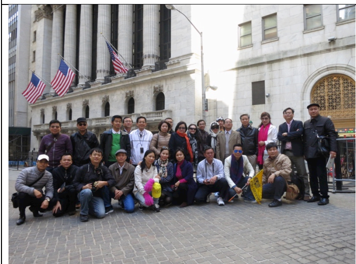
Khảo sát thực tế tại phố Wall, thành phố New York