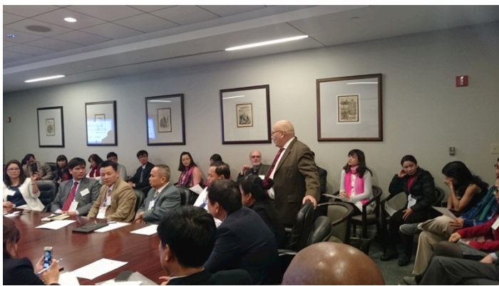
Tìm hiểu luật thương mại liên quan đến TPP tại vp luật Sandler Travis and Rosenberg, Washington DC