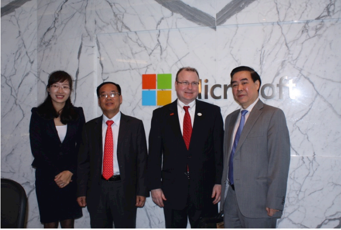
Doanh nghiệp Việt Nam với đại diện Hội đồng Ngoại thương Quốc gia Mỹ và Thương vụ Việt Nam tại Mỹ