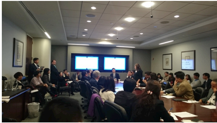
Tìm hiểu luật thương mại liên quan đến TPP tại vp luật Sandler Travis and Rosenberg, Washington DC