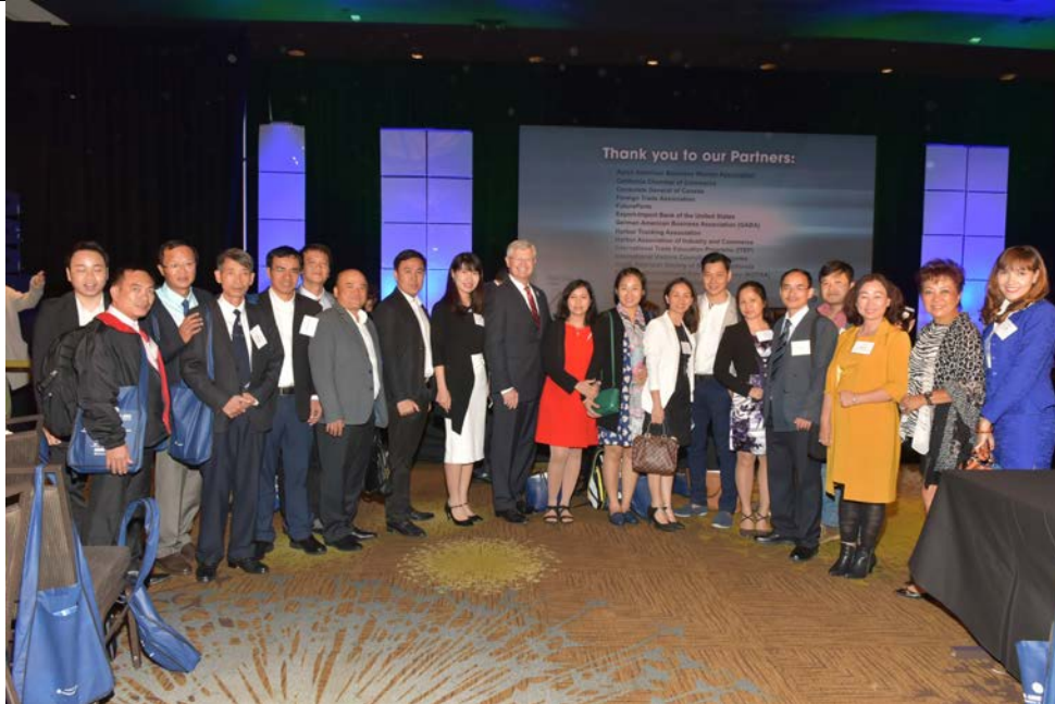
Đoàn chụp ảnh lưu niệm cùng ông Alan McCorkle Chủ tịch Phòng Thương mại Los Angeles