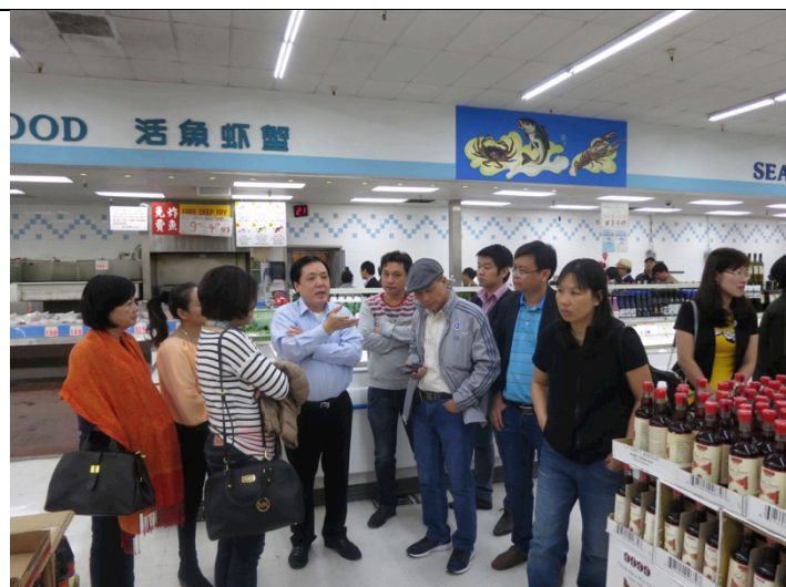
Khảo sát thực tế sự tiêu dùng hàng hoá nguồn gốc châu Á tại Mỹ