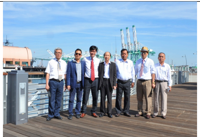
Làm việc với Ban Giám đốc cảng tàu container quốc tế Los Angeles – khảo sát về thủ tục hải quan và quy trình XNK