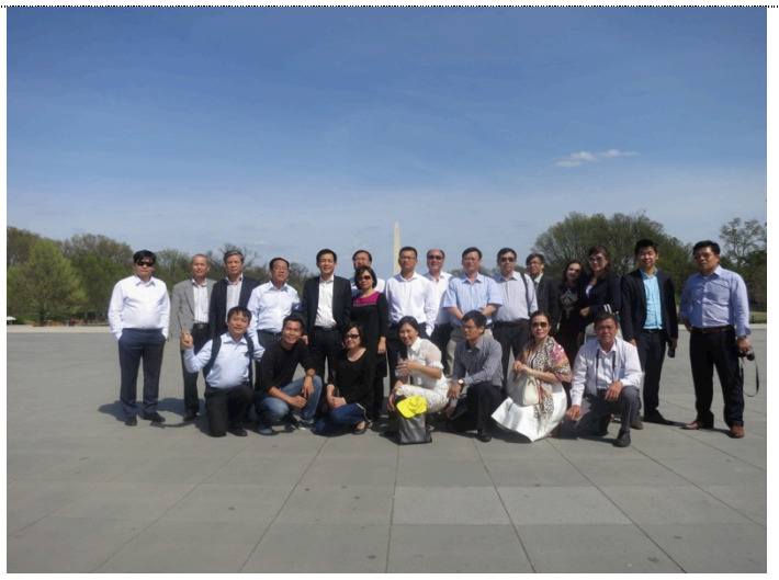
Tham quan thành phố Washington DC và thưởng thức lễ hội hoa anh đào