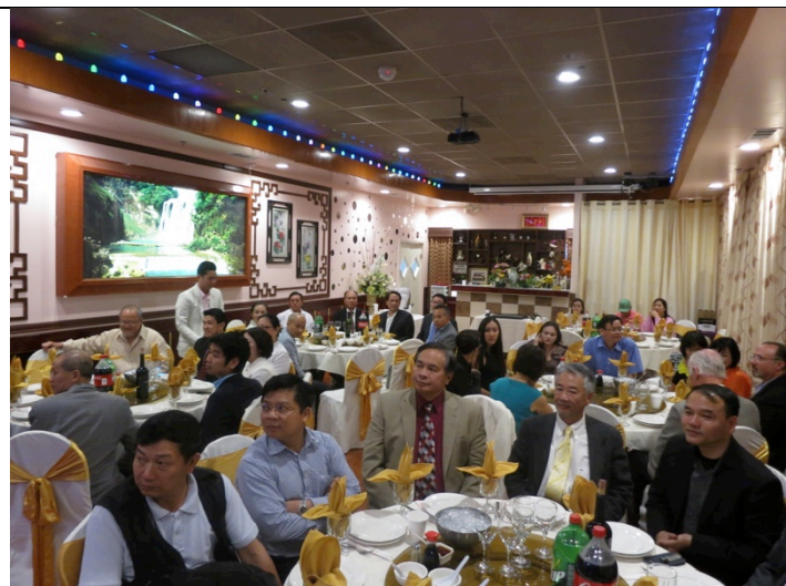
Chương trình gặp gỡ giao lưu với các doanh nghiệp Mỹ do Hội đồng Doanh nghiệp nữ Á Mỹ phối hợp với VCCI tổ chức