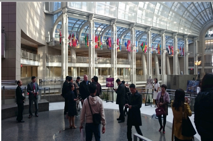
Gặp gỡ các chuyên gia kinh tế và DN Hoa Kỳ trước buổi làm việc tại toà nhà Trung tâm Thương mại Quốc tế, Washington DC