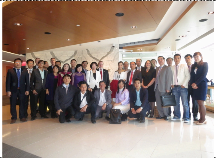
Chụp ảnh lưu niệm sau hội thảo