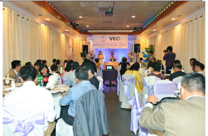
Đại diện Thương vụ Việt Nam tại bờ Tây Hoa Kỳ cung cấp thông tin thị trường cho các doanh nghiệp