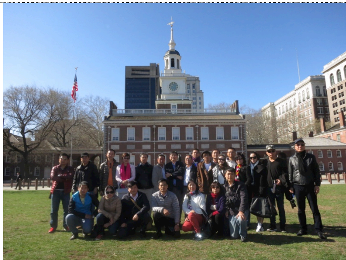
Tham quan thành phố Philadenphia