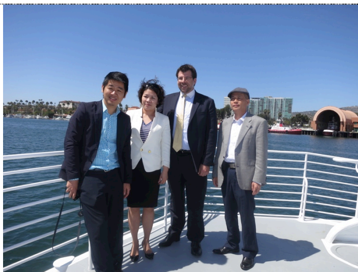
Chụp ảnh lưu niệm với Ban quản lý Cảng quốc tế Los Angeles