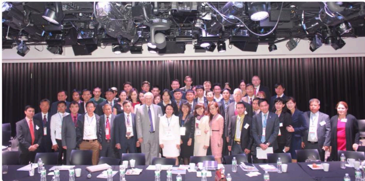
Hội đàm “Thị trường Mỹ: cơ hội và thách thức của doanh nghiệp Việt Nam trước ngưỡng cửa TPP” tại trụ sở tập đoàn Google