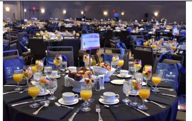
Đoàn tham dự tiệc liên hoan tại Tuần lễ Thương mại Thế giới