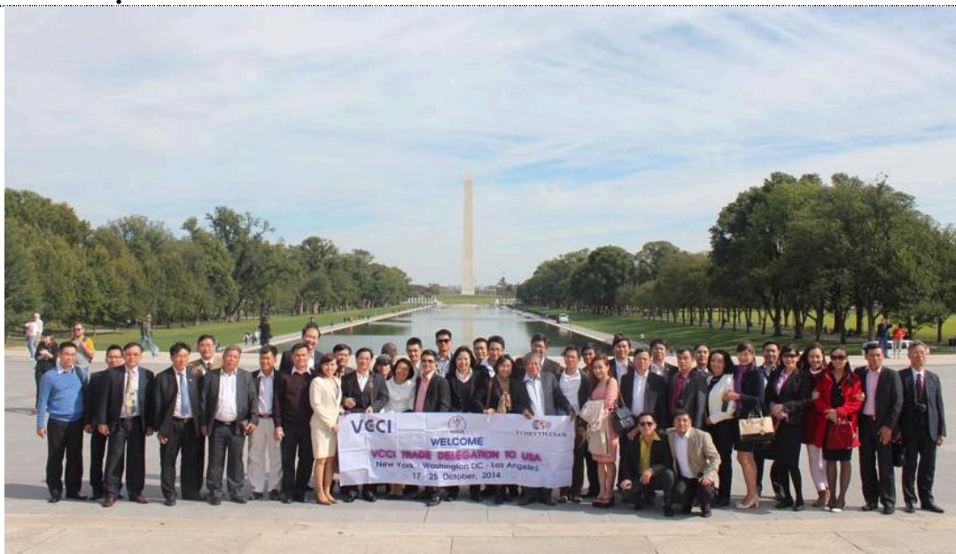
Đoàn tham quan, khảo sát thị trường thành phố Washington