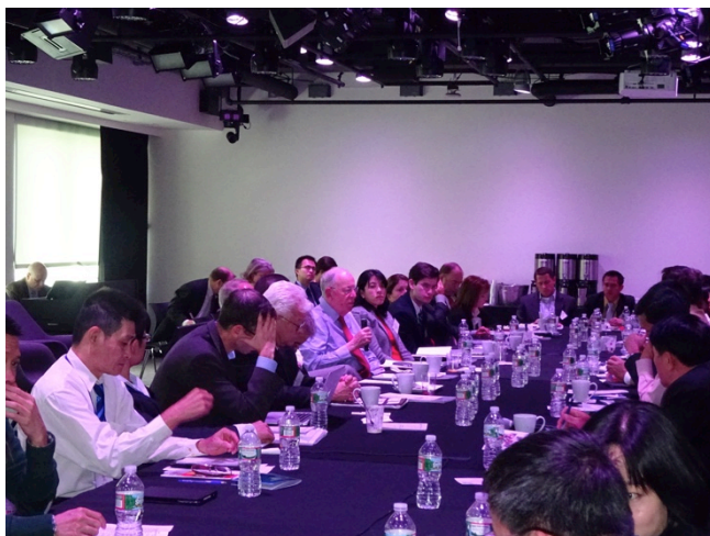
Hội đàm “Thị trường Mỹ: cơ hội và thách thức của doanh nghiệp Việt Nam trước ngưỡng cửa TPP” tại trụ sở tập đoàn Google