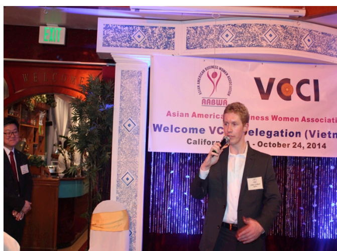
Đại diện Phòng Thương mại Hoa Kỳ trao đổi thông tin thị trường với đoàn Việt Nam