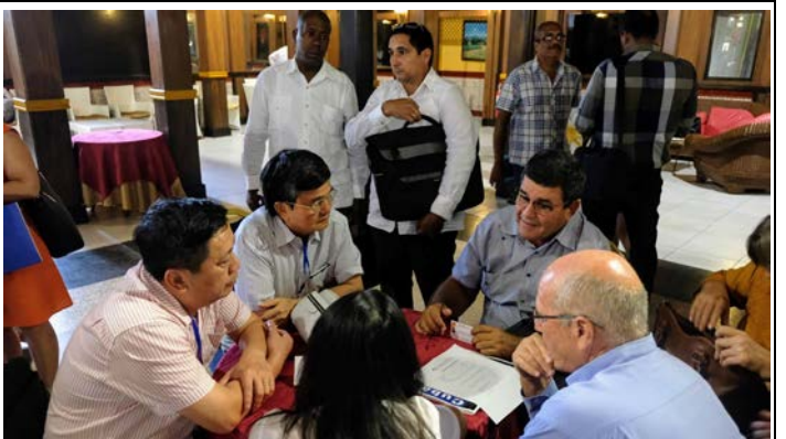
Doanh nghiệp các nhóm ngành hàng Việt Nam gặp gỡ thảo luận với các doanh nghiệp Cuba