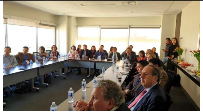
Hội đàm chia sẻ thông tin thị trường, các vấn đề pháp lý trong đầu tư tại Canada