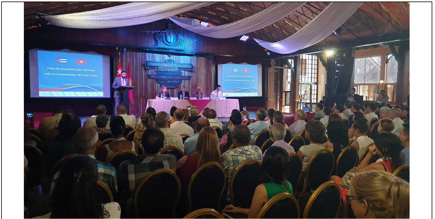
Toàn cảnh Diễn đàn Kinh doanh Việt Nam – Cuba