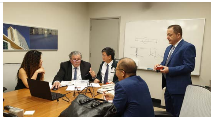
Khảo sát thực tế tại các doanh nghiệp Canada và thảo luận cơ hội hợp tác