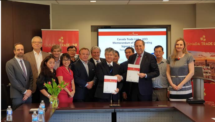
Lễ ký kết Thỏa thuận Hợp tác giữa VCCI & Canada Trade Link nhằm hỗ trợ cộng đồng doanh nghiệp 2 nước trong hợp tác, phát triển và mở rộng thị trường