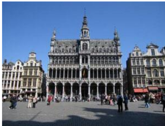
Quảng trường Grand

Đến Bỉ, nhiều du khách sẽ ghé thăm Brussel. Đây là quê hương của tổ chức NATO và liên minh Châu Âu. Tuy thành phố này không được ưa chuộng nhiều như những nơi khác nhưng với lối kiến trúc của thành phố này chắc chắn sẽ làm cho du khách chóng ngợp và thích thú. Tiêu biểu nhất là Quảng trường Grand với lối kiến trúc Gothic, thánh đường Gudule và Michael cùng với công viên Mont des Arts. Một số nơi khác mà du khách có thể ghé thăm đó là quảng trường Royale được xây từ năm 1774 đến năm 1780 với lối kiến trúc của vua Louis đệ XVI, hay bảo tàng nghệ thuật cổ truyền, bảo tàng nghệ thuật hiện đại. Đặc biệt bức tượng chú bé đang tè Manneken-Pis vốn nổi tiếng là biểu tượng của Bỉ là điểm tham quan mà du khách không thể bỏ lỡ. Có rất nhiều dị bản về "lý lịch" chú bé. Người thì cho rằng đây là thiên thần bé nhỏ đã dùng nước tiểu dập tắt mọi đám cháy lớn cứu nguy cho cư dân toàn thành phố. Truyền thuyết khác lại nói đây là một chú bé dũng cảm đã cứu Brussels khỏi bị thiêu hủy bởi quân xâm lược Tây Ban Nha trước khi rút đi. Truyền thuyết cũng kể chú bé huyền thoại này đã nhiều lần bị các đạo quân xâm lược cướp đi nhưng lại luôn tìm được đường về với thành phố quê hương.