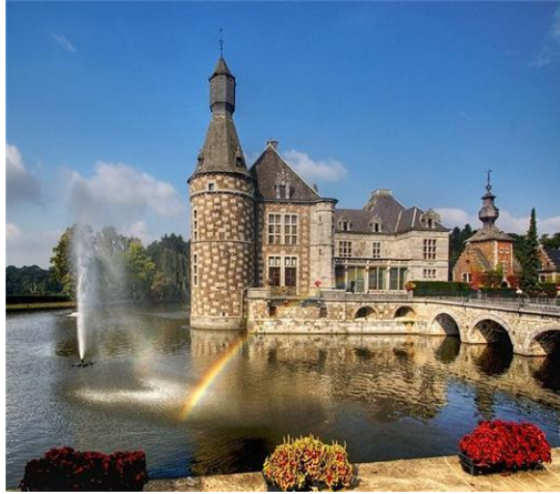
Pháo đài Jehay

Brugge được xem là một trong những thành phố du lịch hấp dẫn nhất, tuyệt vời nhất của Vương quốc Bỉ và của cả châu Âu với cái tên gọi rất gợi cảm “Venise phương bắc”. Tại đây, du khách sẽ tìm lại được những ngôi nhà cổ xưa từ thế kỷ 13, những con đường nhỏ lát đá dành cho những chiếc xe thô mộc từ thời vang bóng, những cối xay gió cùng với những con kênh xinh đẹp. Tất cả những hình ảnh đó sẽ tạo nên một bức tranh cổ xưa đưa bạn về lại với quá khứ, về lại với những năm tháng thời kỳ hoàng kim nhất của lục địa châu Âu già cỗi. Nổi tiếng ở đây là Nhà Thờ Đức Bà với tháp chuông cao nhất châu Âu (120m) được xây bằng đá năm 1089, Tháp chuông Le Beffroi nổi tiếng lớn nhất châu Âu, được xây dựng trong khoảng 1248-1300, cao 83 mét với 366 bậc thang gồm 47 chuông lớn nặng gần 27 tấn.