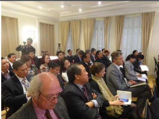
PHÁP: Gặp gỡ các doanh nghiệp, đại diện các tổ chức xúc tiến thương mại Pháp tại thủ đô Paris (2015)