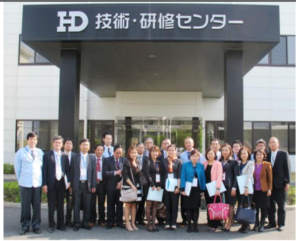
Làm việc tại công ty thuộc tập đoàn Toyota (2013)