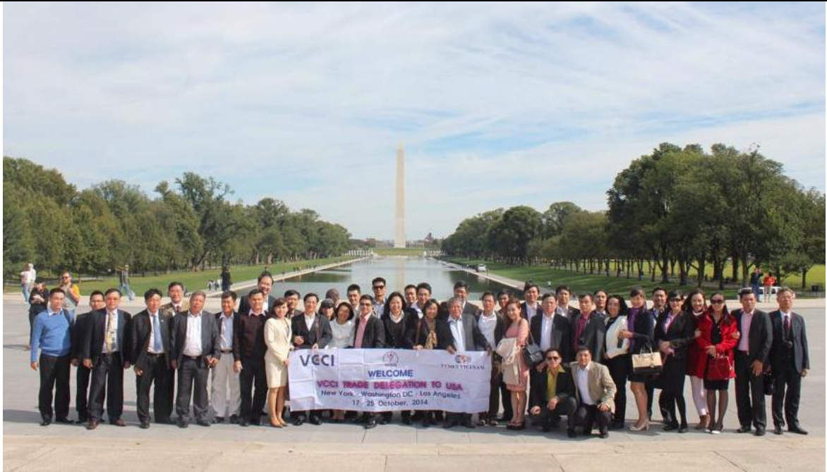
Đoàn tham quan, khảo sát thị trường thành phố Washington (Khoá tháng 10/2014)