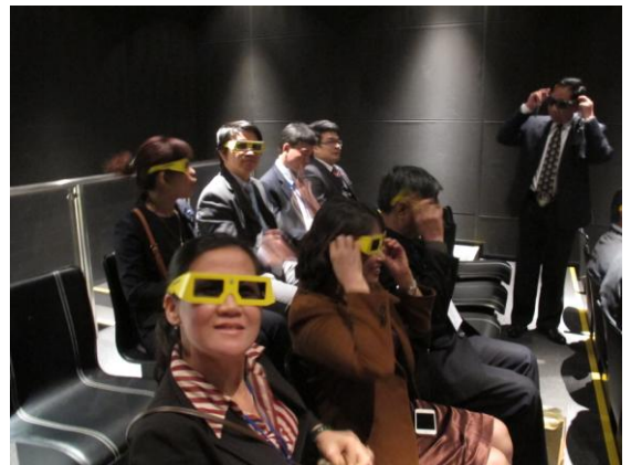
Xem phim 3D về quy trình sản xuất ô tô tại Suzuki