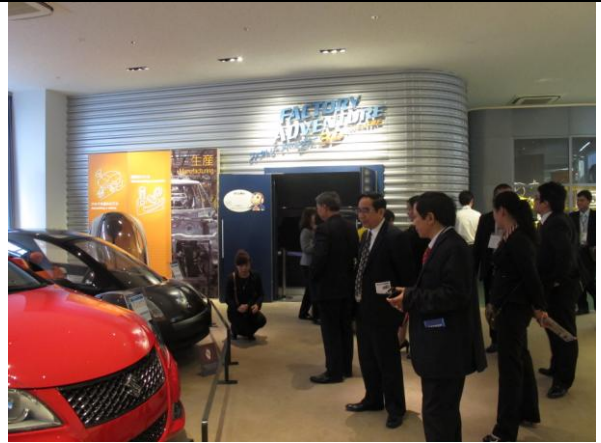
Học tập kinh nghiệm quản lý tại tập đoàn Suzuki Corp