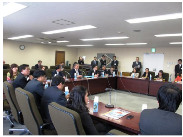
Hội đàm với các doanh nghiệp Nhật Bản (2012)