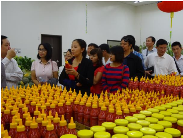
Gặp gỡ doanh nhân Việt thành công tại thị trường Mỹ