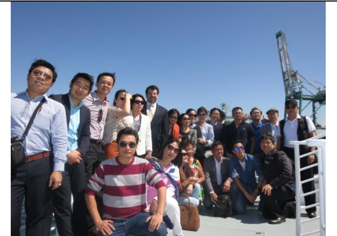
Du thuyền Khảo sát thực tế quy trình vận chuyển, thông quan hàng hoá tại cảng quốc tế Los Angeles