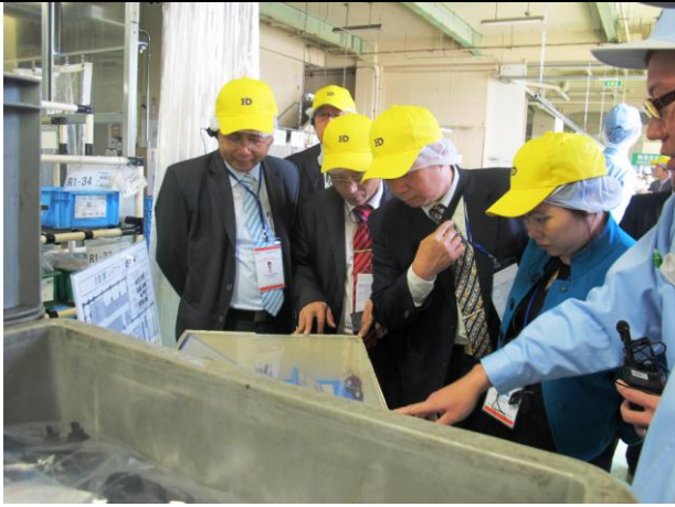
Tham quan công ty HD thuộc tập đoàn Toyota