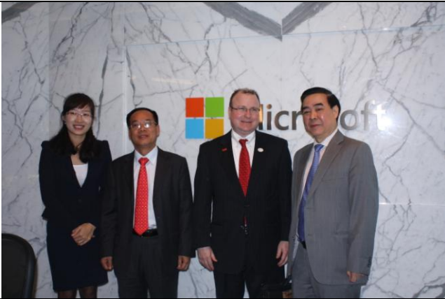
Doanh nghiệp Việt Nam với đại diện Hội đồng Ngoại thương Quốc gia Mỹ và Thương vụ Việt Nam tại Mỹ (tháng 04/2015)