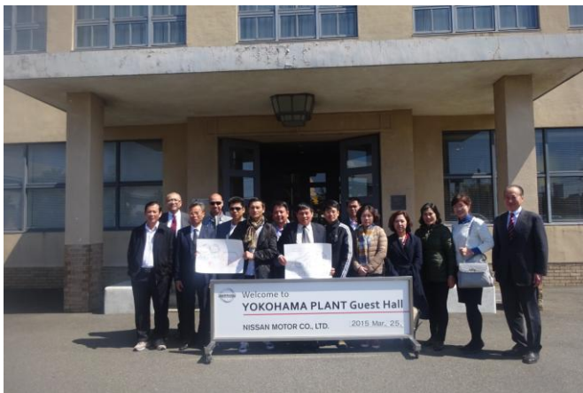
Làm việc tại tập đoàn Nissan, tp Yokohama (2015)