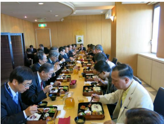
Văn hóa cơm hộp tại công sở với doanh nhân Nhật