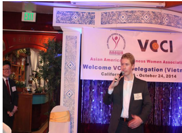
Đại diện Phòng Thương mại Hoa Kỳ trao đổi thông tin thị trường với đoàn Việt Nam