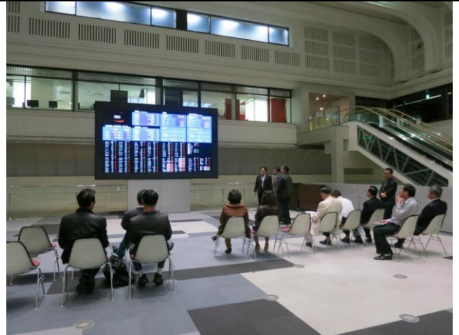
Thực tập tại Sở Giao dịch chứng khoán Tokyo