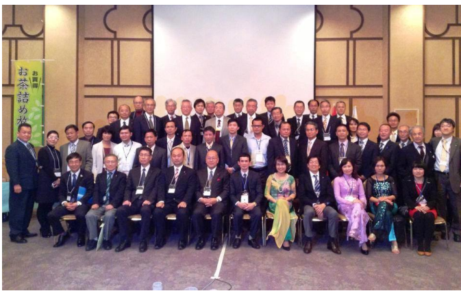
Gặp gỡ lãnh đạo Phòng TM và doanh nghiệp Nhật Bản (2013)