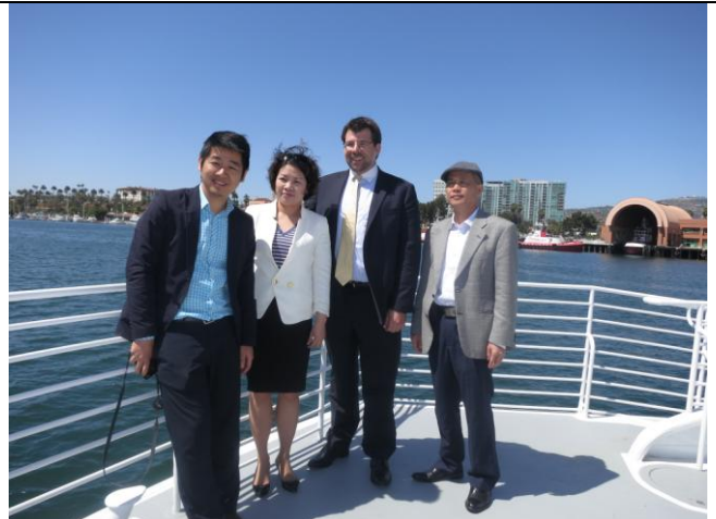
Chụp ảnh lưu niệm với Ban quản lý Cảng quốc tế Los Angeles