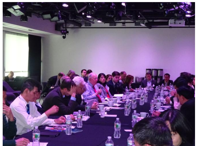
Hội đàm “Thị trường Mỹ: cơ hội và thách thức của doanh nghiệp Việt Nam trước ngưỡng cửa TPP” tại trụ sở tập đoàn Google