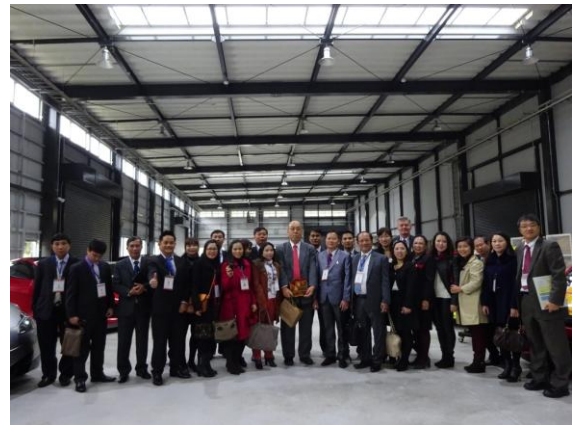
Làm việc với ban lãnh đạo tập đoàn Tajima Motor (2014)