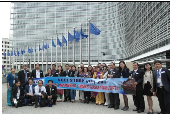
BỈ: Hội thảo về Hiệp định Thương mại tự do Việt Nam – EU tại Hội đồng Liên minh châu Âu (EU Commission)