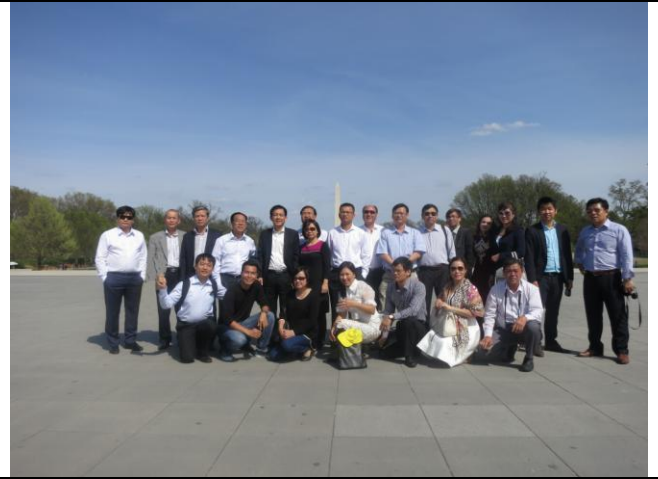
Tham quan thành phố Washington DC và thưởng thức lễ hội hoa anh đào