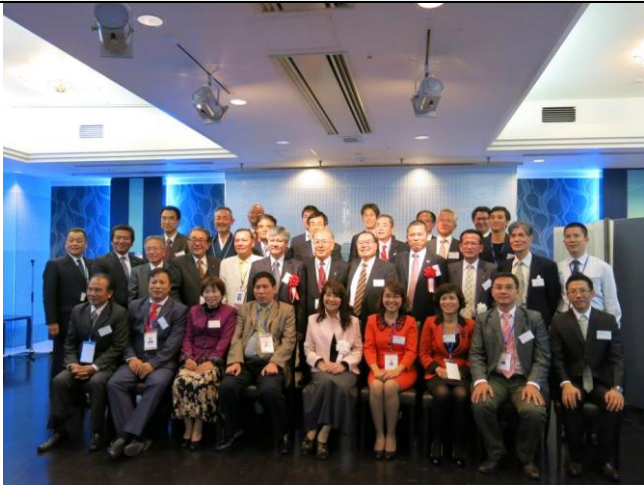
Gặp gỡ lãnh đạo Phòng TM và doanh nghiệp Nhật Bản (2012)