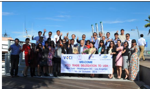
Làm việc với Ban Giám đốc cảng tàu container quốc tế Los Angeles – khảo sát về thủ tục hải quan và quy trình XNK