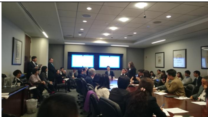
Tìm hiểu luật thương mại liên quan đến TPP tại vj luật Sandler Travis and Rosenberg, Washington DC