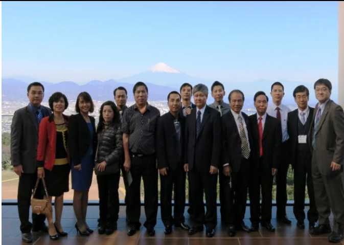
Ngắm đỉnh núi Phú Sỹ - đỉnh núi cao nhất Nhật Bản