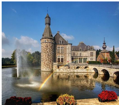
Pháo đài Jehay

Đặc biệt, bạn còn có thể tham quan các thắng cảnh nổi tiếng của tất cả các nước châu Âu trong vòng nửa ngày. Từ trung tâm Brussel, bạn chỉ mất 15 đến 20 phút bằng tàu hay xe buýt để đến khu Heysel, nằm phía Bắc Brussel. Ở đây, bạn sẽ có dịp chiêm ngưỡng tất cả thủ đô của các nước châu Âu. Đó là công viên Mini-Europe, một châu Âu thu nhỏ với những công trình kiến trúc nổi tiếng khắp thế giới như Tháp Eiffel, Tháp nghiêng Pisa, Đồng hồ Big Ben... tại thủ đô châu Âu này. đây, bạn có thể cảm nhận như bạn đang đi du lịch qua từng nước. Đó là Paris, với những hình công trình đã quen thuộc như Tháp Eiffel, Cổng chào chiến thắng (Arc de Triomphe) trên đại lộ Charle De Gaulle, Nhà thờ Sacre-Coeur trên đồi Montmartre và Lâu đài Chenonceaux ở giữa dòng Cher. Mọi thứ đều được tái hiện hoàn hảo, kể cả sông Cher hay đồi Montmartre. Còn biết bao những mô hình tuyệt đẹp, từ những nước nhỏ hơn như Áo, Séc, Đan Mạch, Hà Lan, Lithuania, Litvia... Mỗi khi bạn bước chân vào một quốc gia nào đó, bạn sẽ nghe quốc ca của nước đó cất lên. Một không gian hoàn hảo! Bên cạnh những công trình kiến trúc, ở đây còn tái hiện một châu Âu với các thành tựu khoa học kỹ thuật.