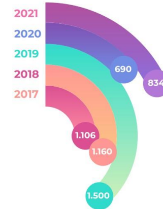
DOANH NGHIỆP TRIỂN LÃM