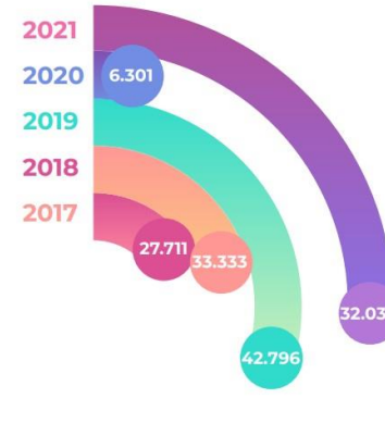
KHÁCH THĂM QUAN