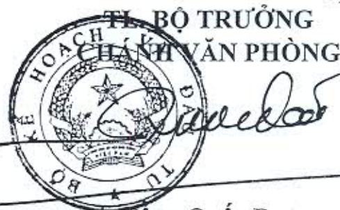
Tông Quốc Đạt